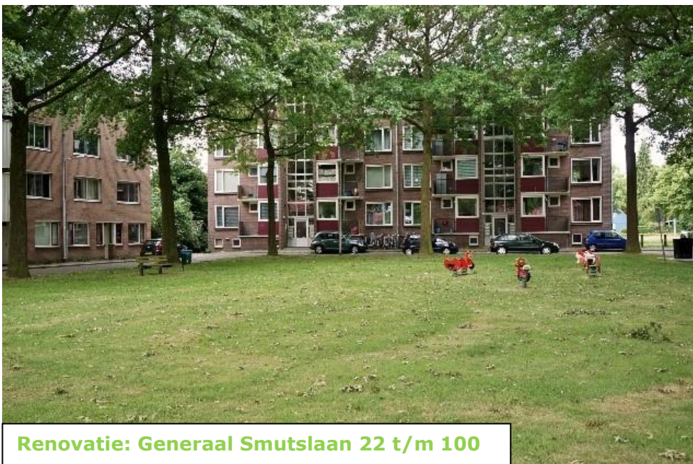
Renovatie: Generaal Smutslaan 22 t/m 100