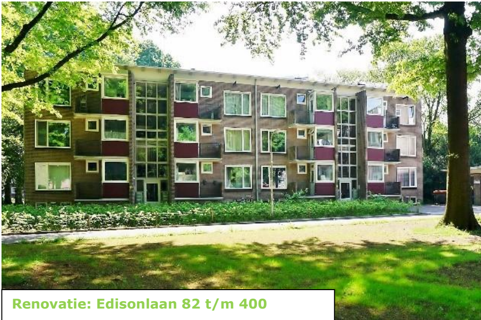
Renovatie: Edisonlaan 82 t/m 400